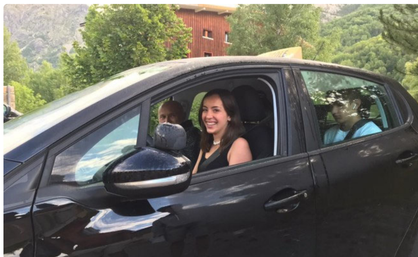
Permis de conduire

Une formation à la conduite accompagnée le temps des vacances pour joindre l'utile à l'agréable.