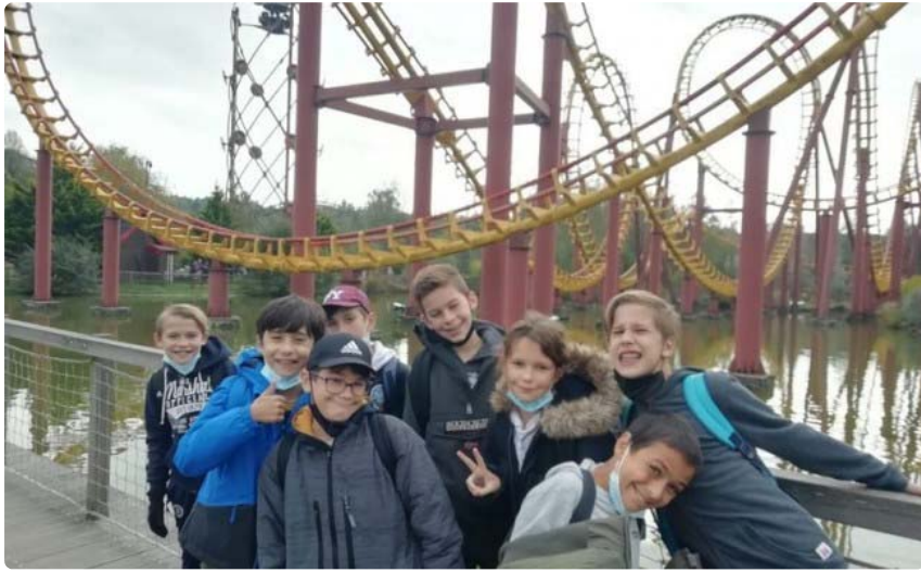
Parc d'attraction - Visites / tourisme

Un séjour magique où on en prendra plein les yeux !